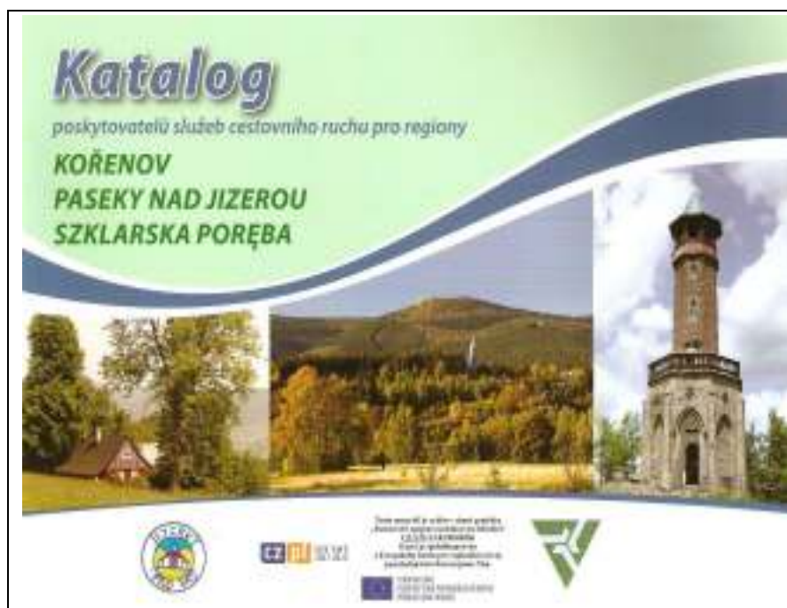
Katalog poskytovatelů služeb cestovního ruchu pro regiony Kořenov, Paseky nad Jizerou a Szklarska Poreba